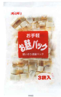
お手軽お麩パック3P 8g×3

荷 姿 12×8 商品サイズ 270×160×50 JANコード 4973322 011145 ITFコード 14973322 011142