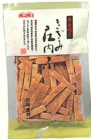
厚釜焼き きざみ庄内ふ40g