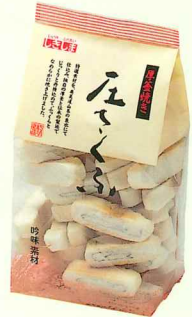
厚釜焼き 圧さくふ46g