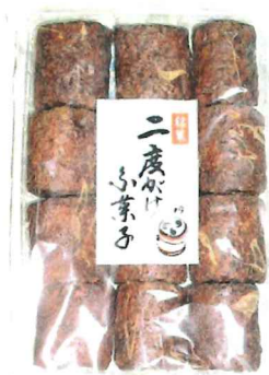
12個二度がけふ菓子

荷姿12×9商品サイズ250×200×40 JANコード4973322 173539 GTINコード14973322173536