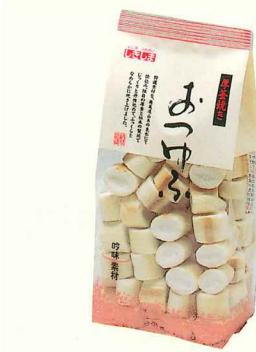
厚釜焼き おつゆふ40g