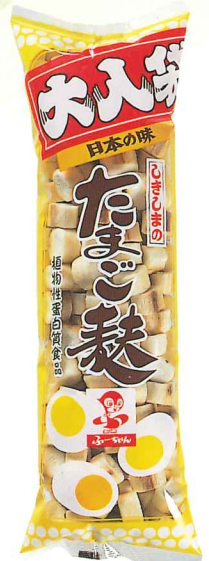
大入袋 たまご麩 70g

荷 姿 15x4 商品サイズ 420x135x85 JANコード 4973322 010117 ITFコード 14973322 010114