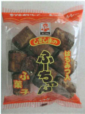
ベストふーちゃん50g

荷姿12×8商品サイズ200×180×40 JANコード4973322 170118 GTINコード14973322170115