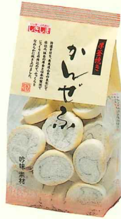
厚釜焼き かんぜふ40g