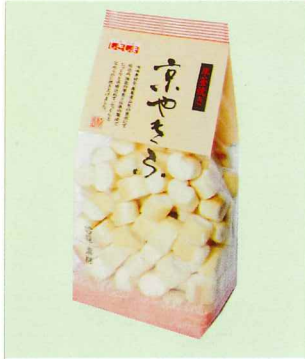
厚釜焼き 京やきふ43g