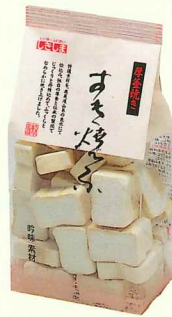
厚釜焼き すき焼ふ60g